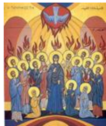
(naar Manu Verhulst)