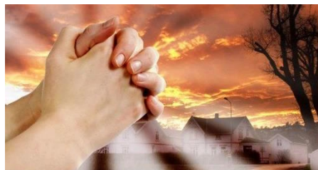
Biddende handen zijn de beste wapens

Wij bidden om verhooring en vragen U altijd dat mensen mogen weten dat Gij hun Vader zijt.